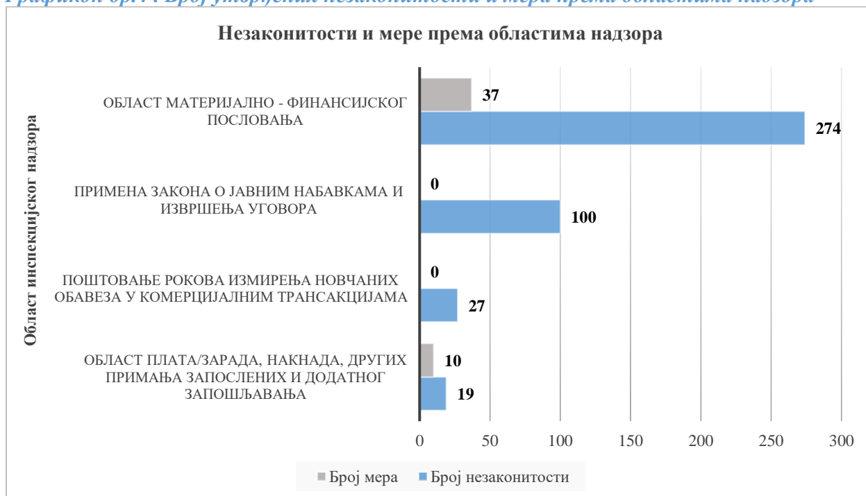
Графикон бр.4 . Број утврђених незаконитости и мера према областима надзора