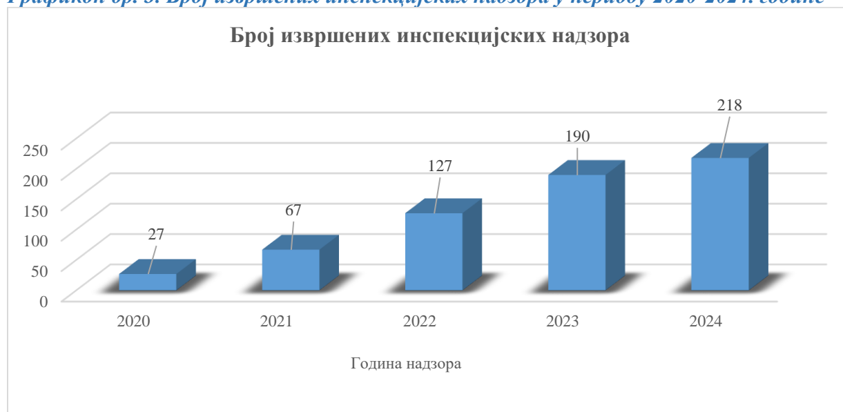
Графикон бр. 3. Број извршених инспекцијских надзора у периоду 2020-2024. године

Извор: Службене евиденције буџетске инспекције за 2020, 2021, 2022, 2023. и 2024. годину